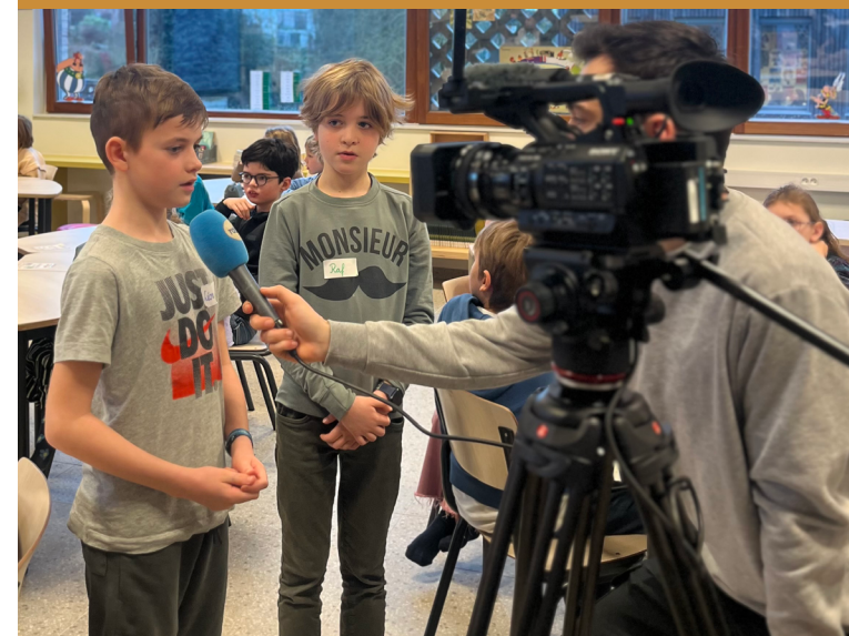
Leerlingen worden geïnterviewd over dierenwelzijn

Verzinnen de kinderen een leuke actie? Nodig de schepen van dierenwelzijn uit om te komen kijken, en wie weet komt er zelfs wat (lokale) pers op af!