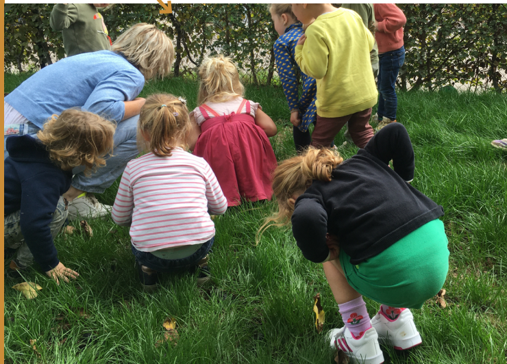
Kleuters doen kippen na

'Oog in oog' biedt een uniek, gratis begeleidingstraject dat jou helpt om dat veelomvattende thema concreet te maken. Kies subthema's die jouw leerlingen raken, zoals huisdieren, landbouwdieren of exotische dieren. Werk samen aan bewustwording en betrokkenheid en laat je leerlingen een concrete actie formuleren.