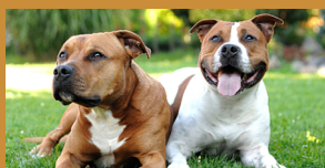
Les 2: Dierethiek en dierenwelzijn

Ontdek 'Oog in oog: Dierenwelzijn in de klas', een project van Dierenwelzijn Vlaanderen.