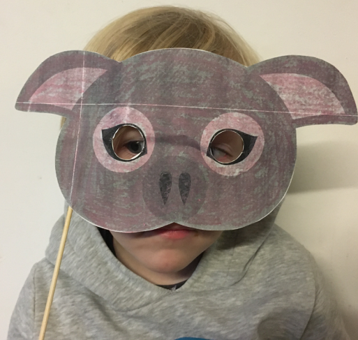
Kleuter met varkensmasker

Stuur een mailtje naar info@dierenwelzijnindeclas.be .