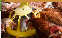
Les 7: Het welzijn van boerderijkippen